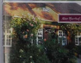
Alter Pfarrhof Bamhow

Breitblättriges Knabenkraut, Kuckuckslichtnelke und Wiesenschaumkraut – die traditionelle Bewirtschaftung mit unterschiedlichen Mahdperioden lässt eine große Artenvielfalt gedeihen, die es nur noch im Wiesenpark zu bestaunen gibt.