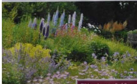
Wildstaudengarten Groß Potres

Dann sollten Sie Mecklenburg-Vorpommern kennenlernen! Das vielfältige Bundesland heißt Besucher in seinen schönsten Parks und Gartenparadiesen willkommen.